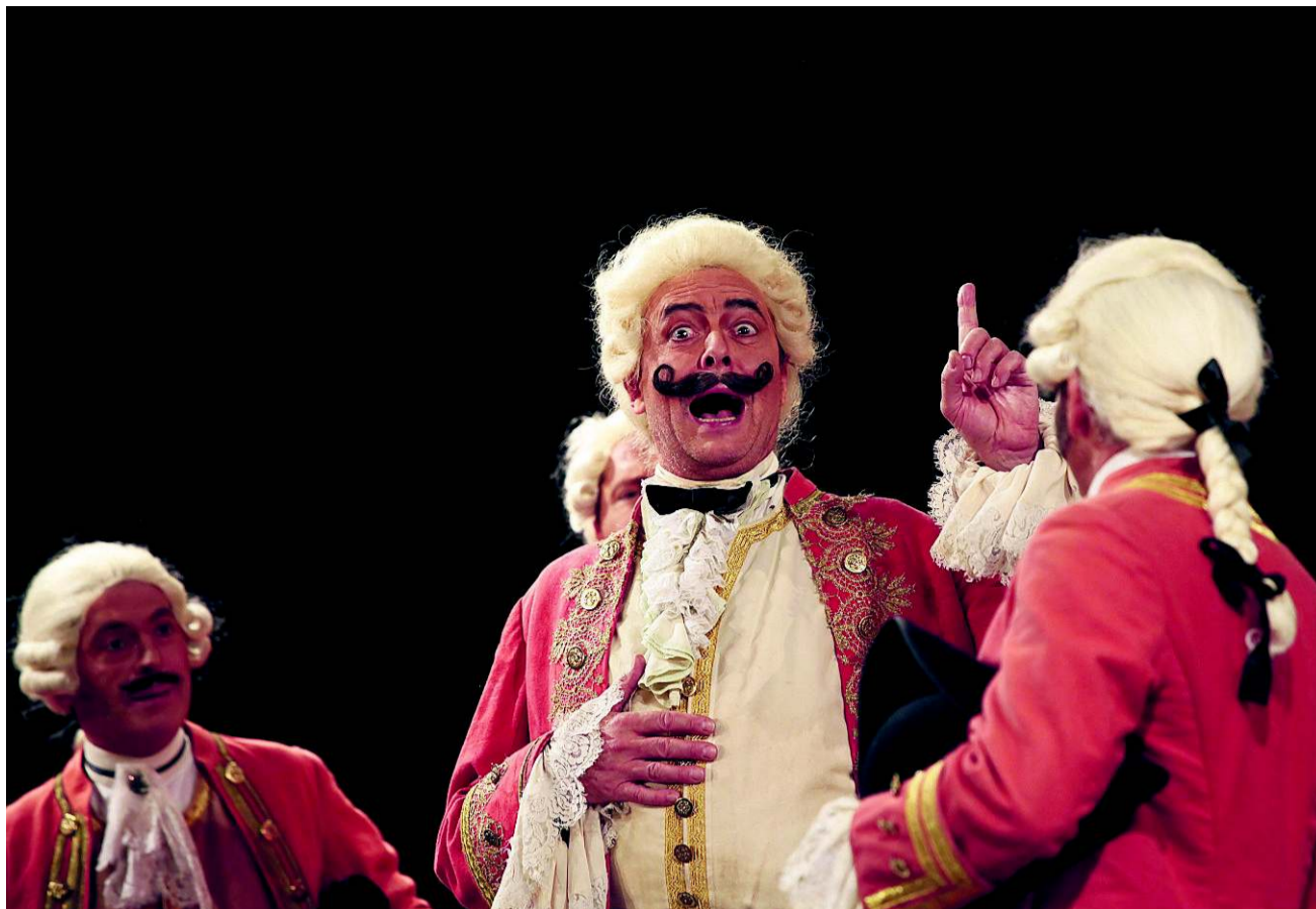
Am Freitag und Samstag ist im Möriker Gemeindesaal «Der Bettelstudent» nochmals zu sehen.