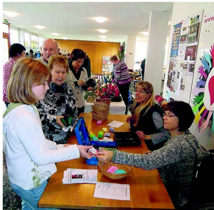
Eine reichhaltige Tombola lockte zum Kauf der Lose.

Wie jedes Jahr fand im Alters- und Pflegeheim der Herbstbrunch statt. Viele Gäste, auch von auswärts, genossen die wunderbaren Köstlichkeiten. Zum ersten Mal nahmen auch